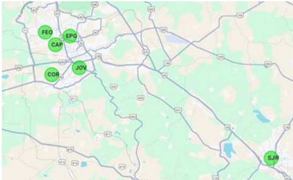
Mapa 1. Ubicación de estaciones de monitoreo SMCAQ

Se cuenta con 5 estaciones en la Zona Metropolitana de Querétaro (ZMQ) y 1 estación en el municipio de San Juan del Río (SJR).