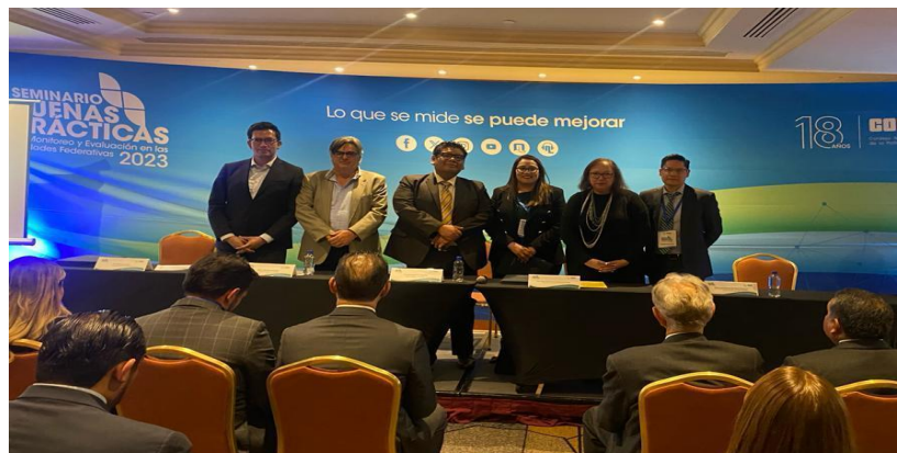
Imagen 4: Entrega de Reconocimiento de Buenas Prácticas de SIPROS