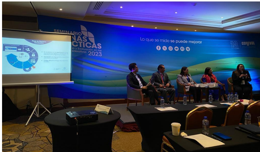
Imagen 3: Presentación sobre la Buena Práctica de SIPROS