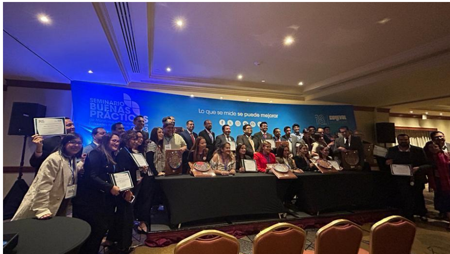
Imagen 5: Clausura del Seminario de Buenas Prácticas de Monitoreo y Evaluación en las Entidades, Municipios y OSC 2023